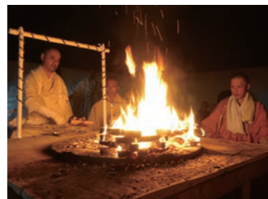
神崎神社 護摩焼き 神崎神社 护摩焚