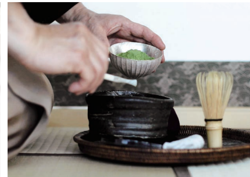
茶道体験 / 茶道体验