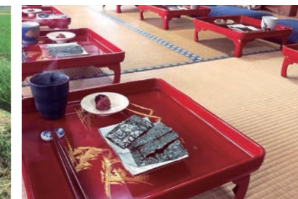
ファスティング合宿 断食合宿