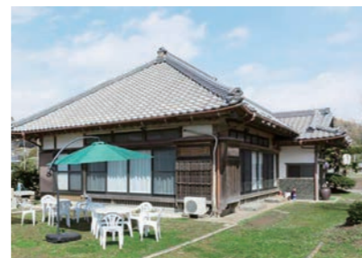
椿 HOUSE 外観 椿 HOUSE 外观