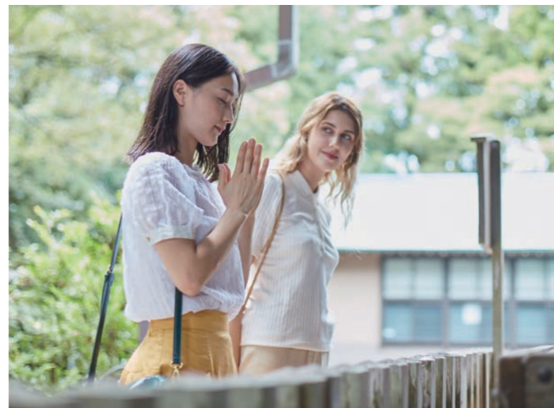
神崎神社 参拝 / 神崎神社 参拜

農作体験、発酵食品制作、護摩焚き等等、 我们准备了一整年的日本文化、乡土文化体验活动。 透过各种活动企划， 体验神崎町四季独有的魅力。