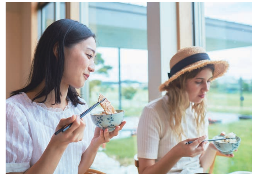
道の駅 発酵の里こうざき「レストランオリゼ」 道之驛 发酵之里神崎「Restaurant Orize」

以拥有300年以上历史的「锅店」及「寺田本家」两大酒蔵为中心，每年3月所举办的「酒蔵祭」吸引了5万人以上到访，相当热闹。