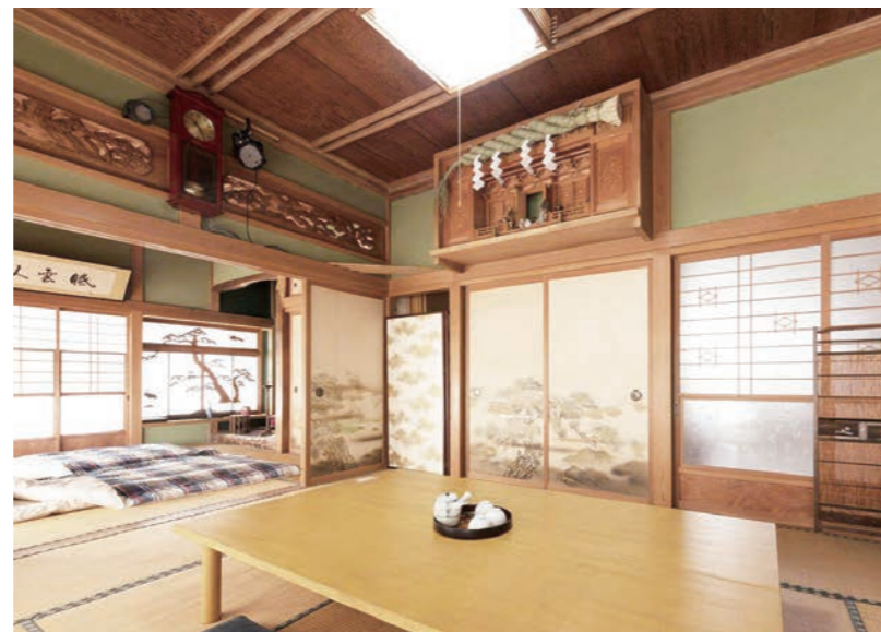
椿 HOUSE 室内 / 椿 HOUSE 室内