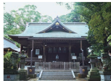
神崎神社 本堂 神崎神社 本堂