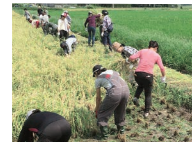
農業体験 农作体验