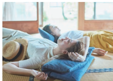
畳で休憩 在榻榻米上休憩