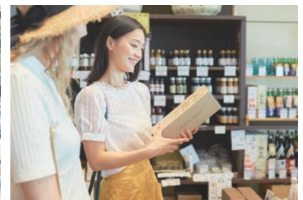
道の駅 発酵市場 道之驛 发酵市場