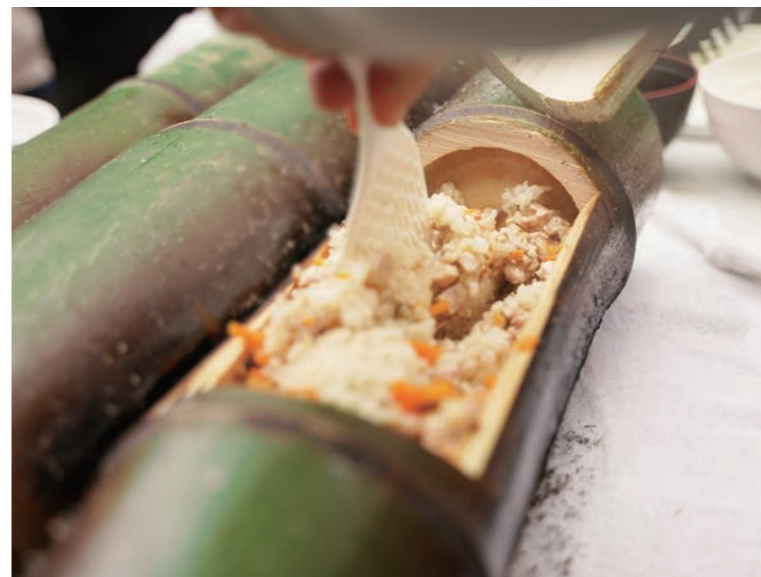
竹筒BBQ / 竹筒 BBQ